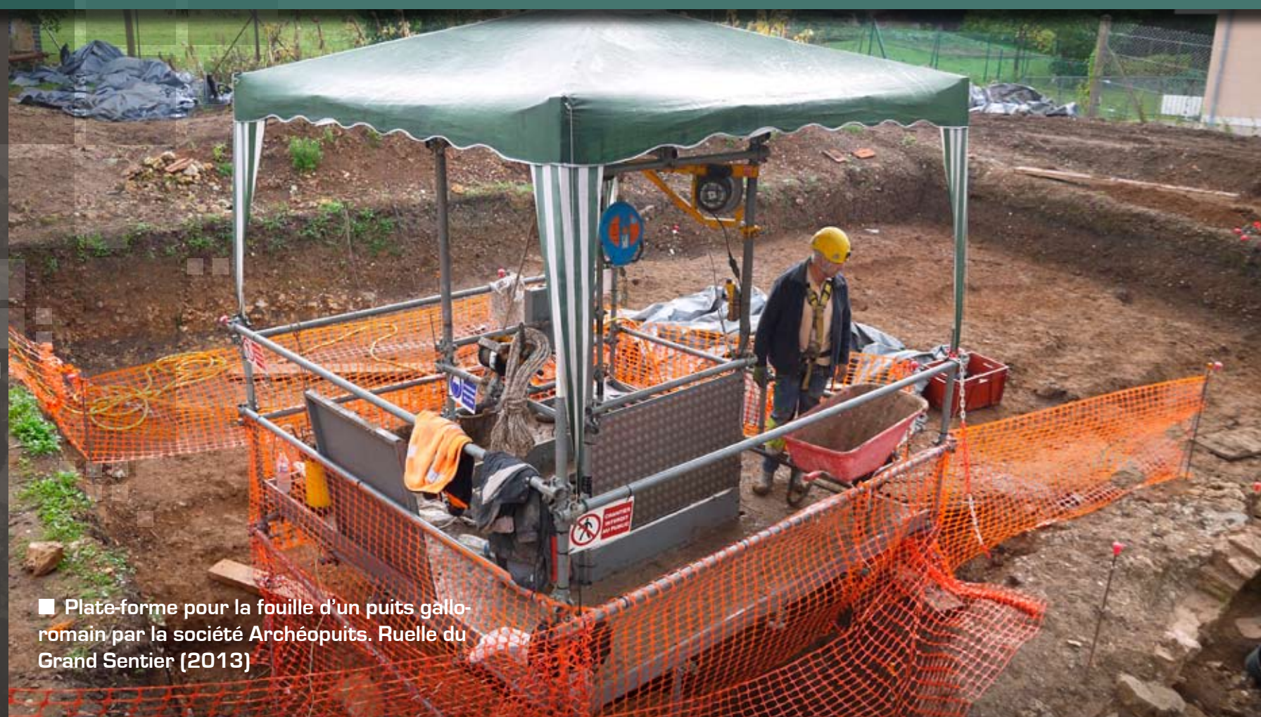
■ Plate-forme pour la fouille d'un puits gallo-romain par la société Archéopuits. Ruelle du Grand Sentier (2013)