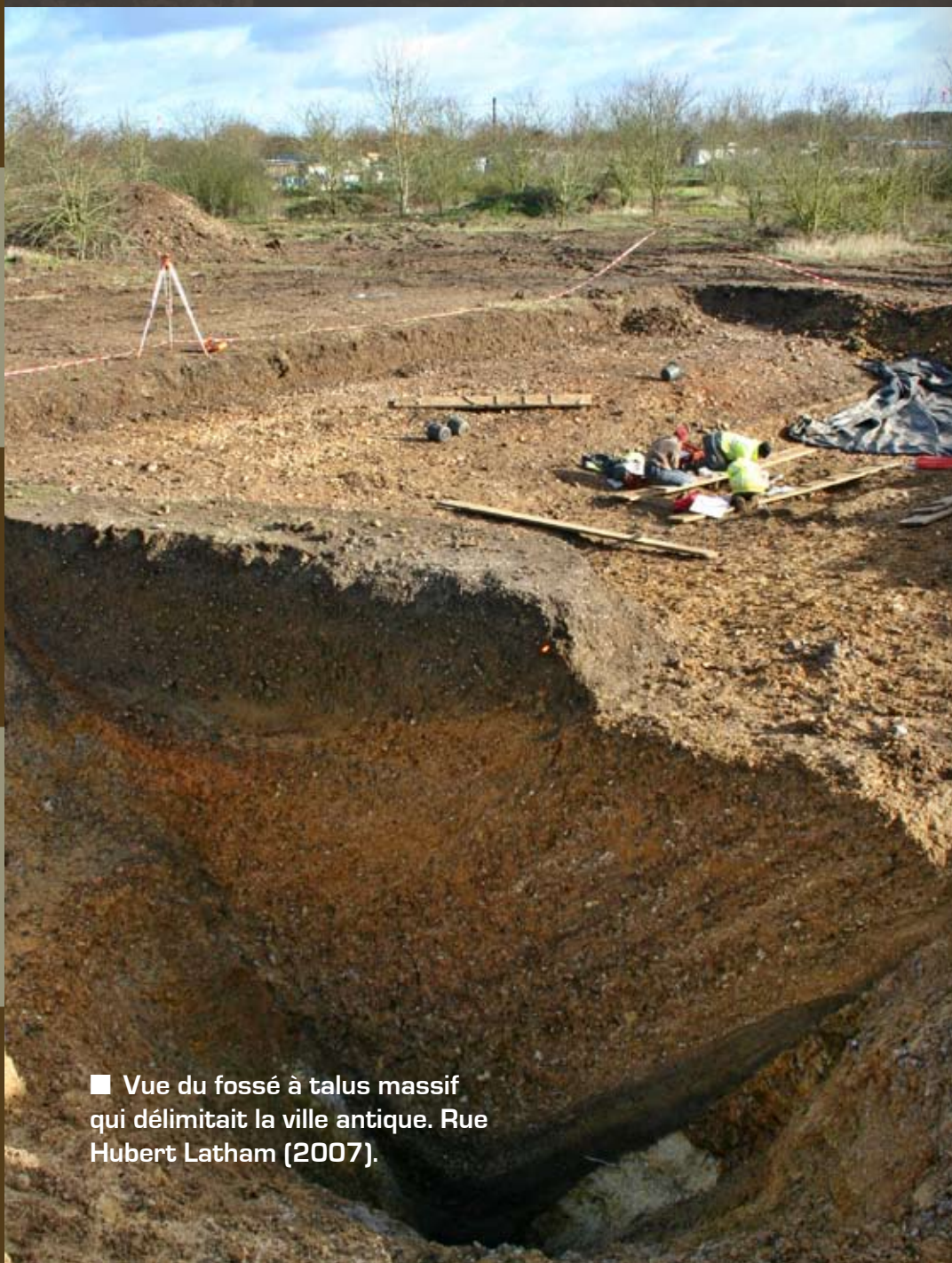
■ Vue du fossé à talus massif qui délimitait la ville antique. Rue Hubert Latham (2007).

Au 1 er siècle de notre ère, la ville d'Autricum se développe selon le schéma d'une ville romaine. Au sommet du plateau qui surplombe l'Eure, s'établit le forum (place publique). Au bord de l'Eure, un amphithéâtre est construit (au niveau du cloître Saint-André). Un réseau de voies empierrées quadrille la ville. Deux aqueducs acheminent l'eau aux habitants. Un sanctuaire monumental est édifié.