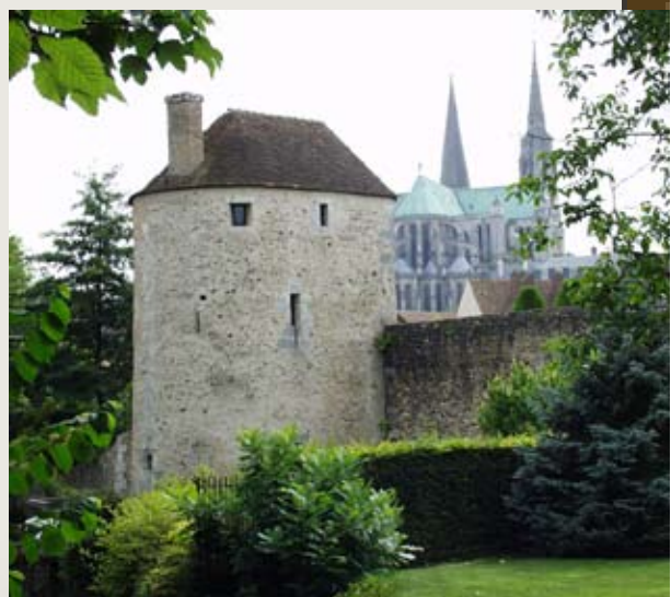
■ Tour du Massacre appartenant à l'enceinte du XII e siècle.

La cathédrale de Chartres existe au moins depuis le VIII e s. Sa configuration actuelle résulte des travaux entrepris après les incendies de 1134 et 1194. La tour nord fut achevée au XVI e siècle.