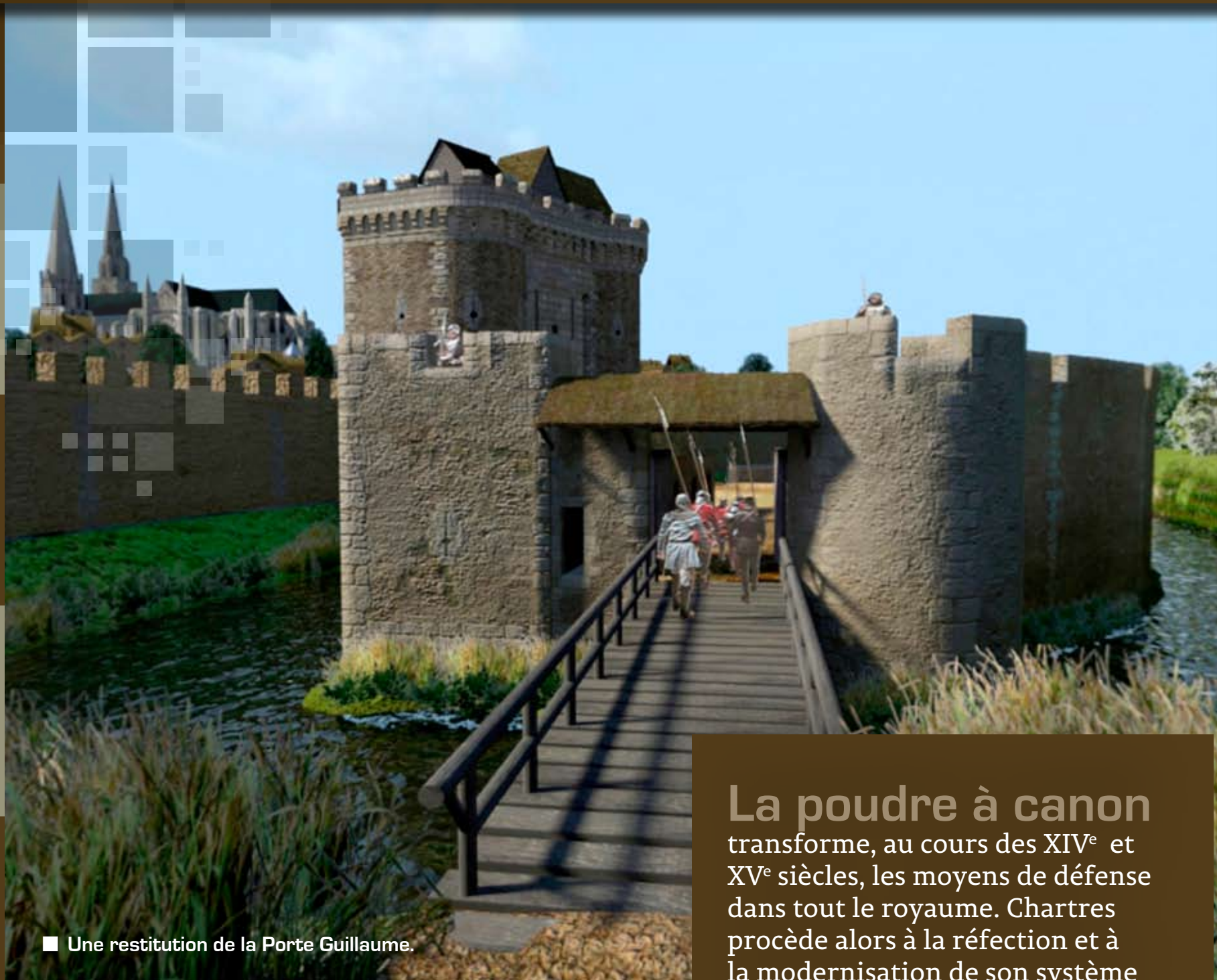
■ Une restitution de la Porte Guillaume.

La poudre à canon transforme, au cours des XIV e et XV e siècles, les moyens de défense dans tout le royaume. Chartres procède alors à la réfection et à la modernisation de son système défensif de la porte Guillaume et se dote d'un ouvrage fortifié : la barbacane.