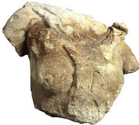
FRAGMENT DE BUSTE