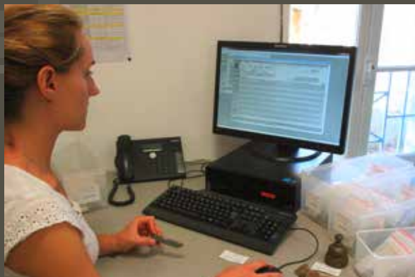
↑ La régisseuse au travail : contrôle de l'inventaire, objet en main.

C'est un outil précieux qui regroupe description et identification des objets et des documents, état de conservation, information de restauration, localisation en temps réel et historique des mouvements.