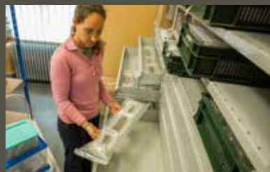
← Rangement des objets fragiles de grandes tailles dans des classeurs à tiroirs.

Ce fonds archéologique est très dense et très divers dans sa composition et ses modes de stockage. Il est aussi très riche en informations sur le passé de la ville et de ses environs. À ce titre, il doit être conservé, étudié et mis en valeur.