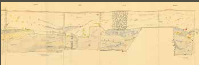
↑ Relevé de coupe dans un sondage réalisé en 1967 près de l'église Saint-André. Le papier a jauni et il est devenu cassant. Un scan haute résolution permettra de le consulter sans avoir à manipuler l'original.

Ces actions ont pour objectif de vérifier que l'inventaire est exact, que chaque objet ou document est présent, en bon état, et stocké dans le contenant dont le numéro est porté dans la base de données. Le récolement révèle le potentiel scientifique des fonds afin de les exploiter au mieux.