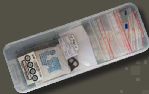
← Les objets en fer, très sensibles à l'humidité, sont conservés dans des boîtes hermétiques, accompagnés d'un matériau absorbant l'humidité, à changer régulièrement.

Certains objets archéologiques, les documents sur papier, les photos argentiques, sont fragiles ou sensibles aux variations des conditions climatiques (température, humidité). Le régisseur contrôle l'environnement direct des objets afin de prévenir tout risque de détérioration.