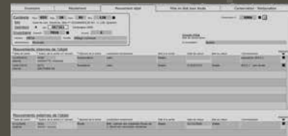
↑ Exemple d'enregistrement des mouvements d'une monnaie, sortie une fois pour étude en 2006 et deux fois en 2015 afin de préparer une exposition.