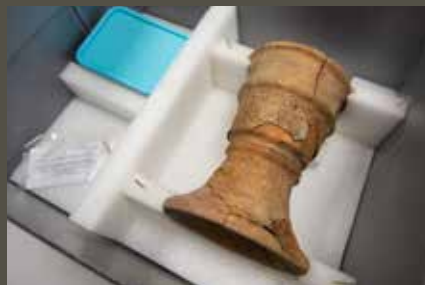
← Les objets fragiles seront conditionnés sur-mesure.