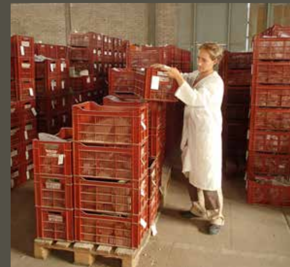
↑ Rangement des caquettes de mobilier en lots dans la réserve après inventaire et récolement.

Toute sortie d'objet ou de document est donc enregistrée dans la base de données : raison de la sortie, auteur, date, date de retour, commentaires, etc. Pour suivre rigoureusement ces mouvements, seul le régisseur est autorisé à accéder aux réserves.