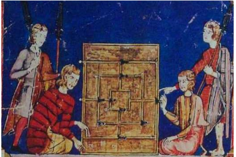
Joueur de Mérelle Livre des Jeux d'Alphonse X Le Sage, 1283

Prendre 7 pions au joueur adverse en alignant des séries de 3 pions sur la même ligne.