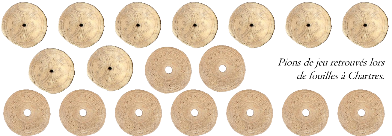
Pions de jeu retrouvés lors de fouilles à Chartres.