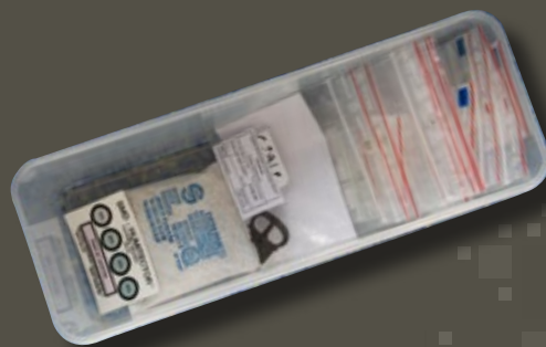
← Les objets en fer, très sensibles à l'humidité, sont conservés dans des boîtes hermétiques, accompagnés d'un matériau absorbant l'humidité, à changer régulièrement.

Certains objets archéologiques, les documents sur papier, les photos argentiques, sont fragiles ou sensibles aux variations des conditions climatiques (température, humidité). Le régisseur contrôle l'environnement direct des objets afin de prévenir tout risque de détérioration.