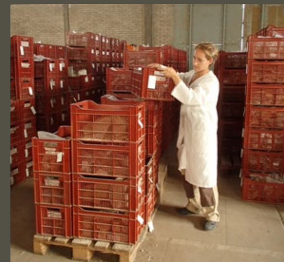
↑ Rangement des caquettes de mobilier en lots dans la réserve après inventaire et récolement.

Toute sortie d'objet ou de document est donc enregistrée dans la base de données : raison de la sortie, auteur, date, date de retour, commentaires, etc. Pour suivre rigoureusement ces mouvements, seul le régisseur est autorisé à accéder aux réserves.