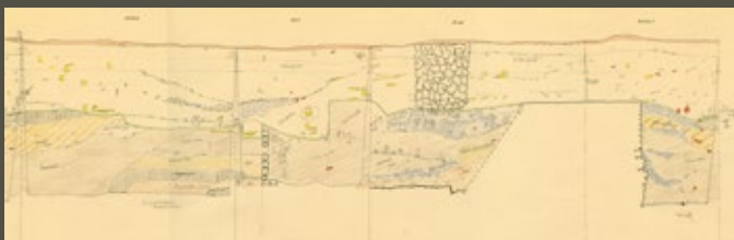
↑ Relevé de coupe dans un sondage réalisé en 1967 près de l'église Saint-André. Le papier a jauni et il est devenu cassant. Un scan haute résolution permettra de le consulter sans avoir à manipuler l'original.

Ces actions ont pour objectif de vérifier que l'inventaire est exact, que chaque objet ou document est présent, en bon état, et stocké dans le contenant dont le numéro est porté dans la base de données. Le récolement révèle le potentiel scientifique des fonds afin de les exploiter au mieux.