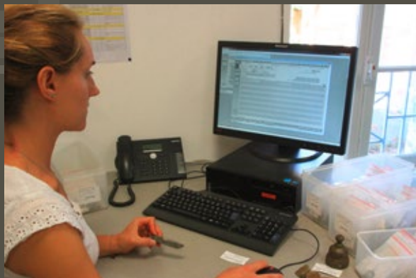
↑ La régisseuse au travail : contrôle de l'inventaire, objet en main.

C'est un outil précieux qui regroupe description et identification des objets et des documents, état de conservation, information de restauration, localisation en temps réel et historique des mouvements.