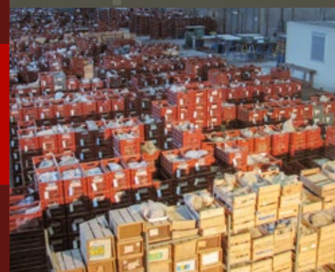
← Réserve des objets lourds et/ou encombrants, le plus souvent des éléments d'architecture ou des pierres façonnées pour un usage domestique (meules ...).