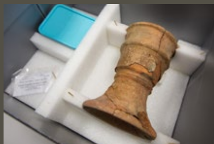
← Les objets fragiles seront conditionnés sur-mesure.