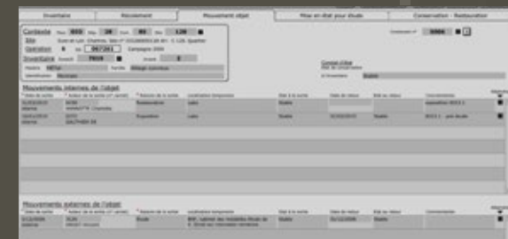
↑ Exemple d'enregistrement des mouvements d'une monnaie, sortie une fois pour étude en 2006 et deux fois en 2015 afin de préparer une exposition.